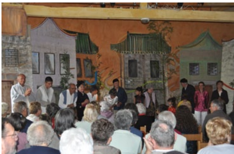
Représentation des Maillabus (Saint-Pierre-de-Maillé)

Revivez en photos la Journée des Associations sur www.vals-gartempe-creuse.com (rubrique Pays).