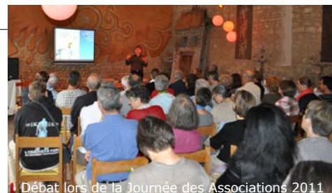
Débat lors de la Journée des Associations 2011

La Journée des Associations, organisée début septembre à Saint-Pierre-de-Maillé, a montré la volonté des acteurs associatifs de faire vivre ce territoire rural. Le matin était consacré à un débat entre les associations présentes et des élus du territoire sur la réforme territoriale. Près de 70 personnes ont pu échanger librement et de façon constructive sur l'intercommunalité et