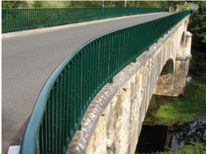
Le Pont de Busserais à La Bussière, rénové par le Chantier d'Insertion durant l'été.