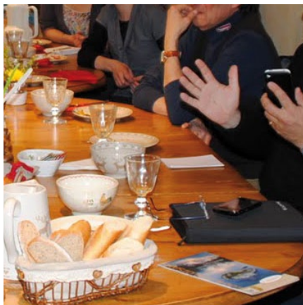
Les acteurs économiques se rassemblent au cours de petits-déjeuners débats (Voir page 2)