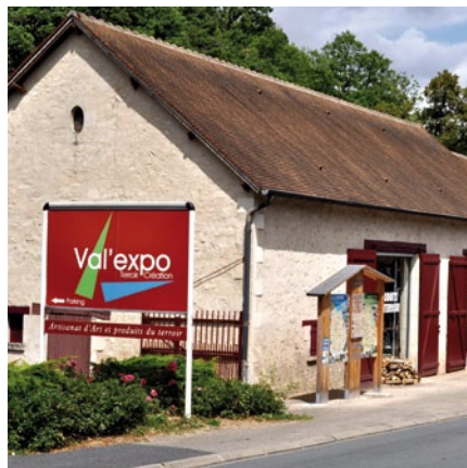
L'association enregistre en 2011 de très bons résultats de fréquentation (Voir page 7)