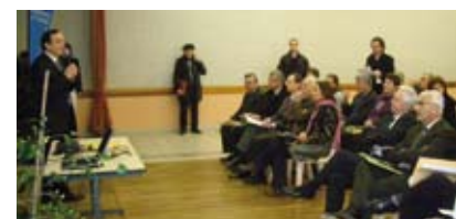
Lors du lancement de l'OPAH, le 21 janvier dernier