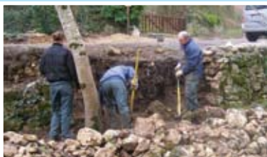
Le muret d'Angles-sur-l'Anglin

Outre la fabrication de mobilier de plein air, l'entretien du Centre d'Interprétation du Roc-aux-Sorciers et des sentiers de randonnée, cette année a été marquée par la réalisation d'expériences nouvelles. En effet, un "abri scolaire" pour les parents d'élèves de Coussay-les-Bois a été entièrement conçu par le chantier. Une grande partie des bureaux de la Communauté de communes a été rénovée, des travaux de rénovation ont été réalisés tels le muret du cimetière d'Angles-sur-l'Anglin et la fontaine de Montant à Mairé, et une partie de l'équipe a participé au démarrage de la nouvelle activité : culture maraîchère et fruitière.