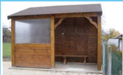
L'abri scolaire de Coussay-les-Bois

En 2009, 25 personnes ont travaillé au sein du chantier d'insertion en Contrat d'Accompagnement dans l'Emploi ou en Contrat Aidé Départemental pour une durée minimum de 6 mois.