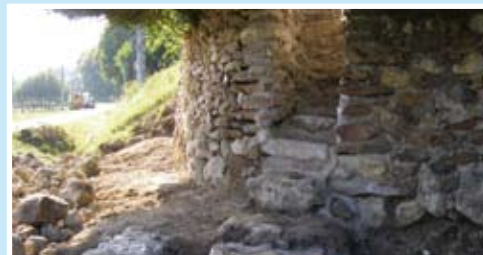
La fontaine de Mairé

Si vous souhaitez intégrer l'équipe faites vérifier votre éligibilité au Contrat d'Accompagnement dans l'Emploi (CAE) auprès de votre conseiller Pôle Emploi ou directement auprès du chantier: 27 avenue Jourde à Pleumartin.